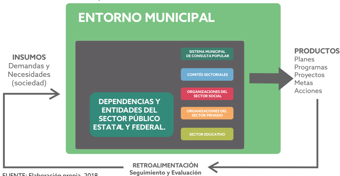
Gráfico 3. Estructura de COPLADEMUN Carmen 2018-2021